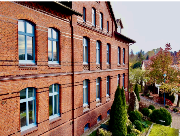
Altbau von 1900