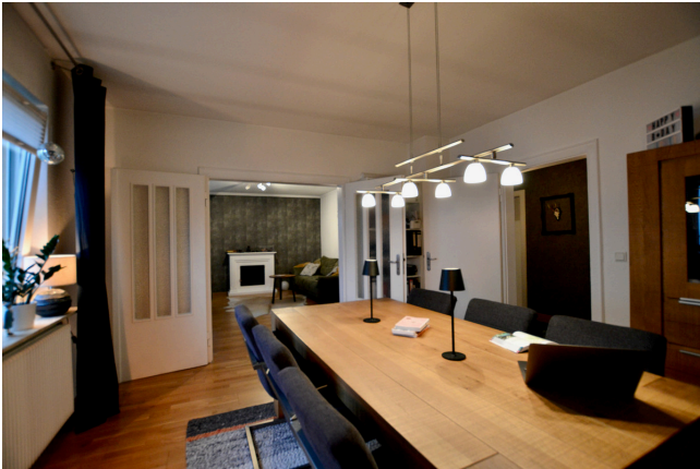
mit Freunden speisen