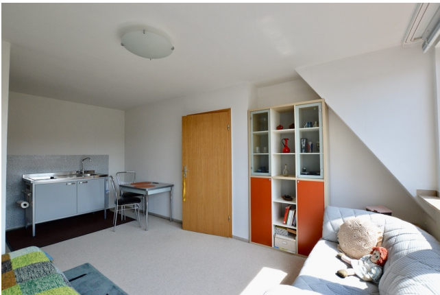
für die Gäste