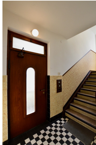
Eingangsbereich mit Stil