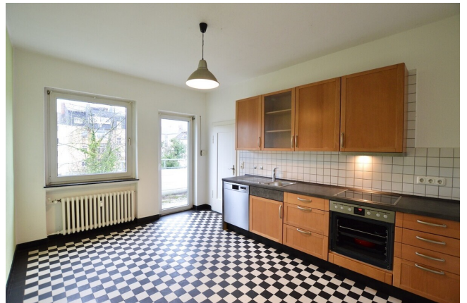
Küche mit liebevollen Details