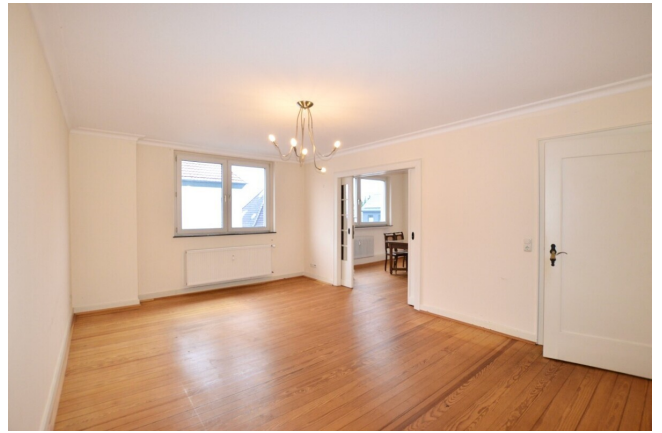
helles großzügiges Wohnzimmer