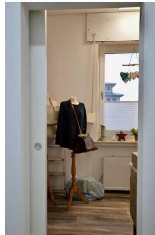
Durchgang zur Küche