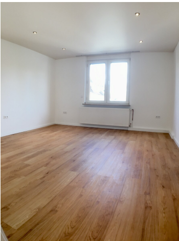
hell und modern